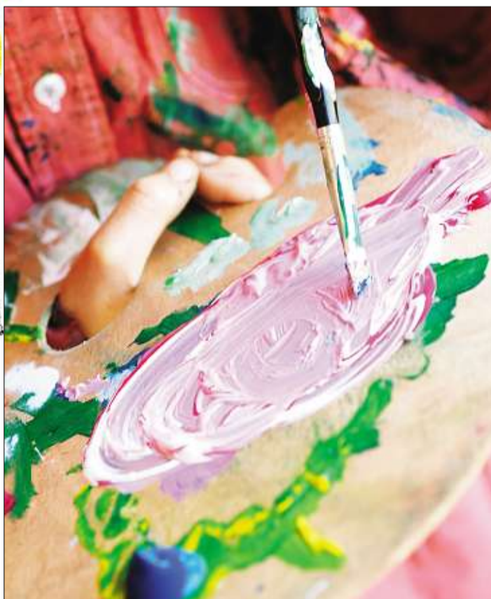
ROSA: Rød og hvit blir rosa, det er ganske enkelt. Men elevene har også lært å lage alle andre farger av primærfargene rød, gul og blå.