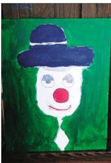
FERDIG: Den ferdige klovnen til Gard Fleming Sveum.